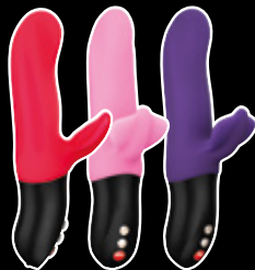
Bi STRONIC FUSION